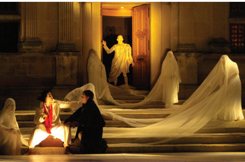
2005 - Dom Juan