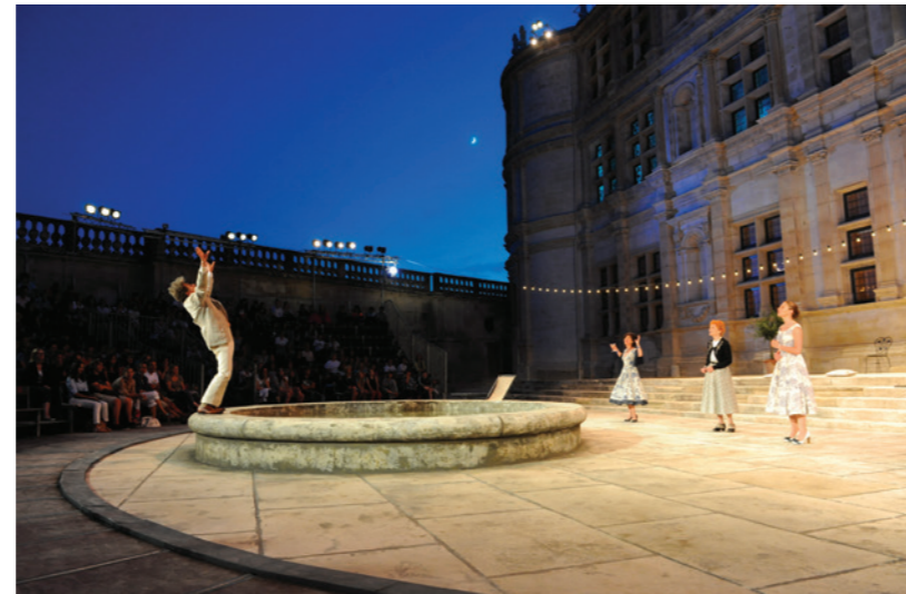
2012 - Les Femmes savantes

2022 marque le 400 e anniversaire de la naissance de Molière, l'immense dramaturge auquel on doit en quelque sorte la naissance des Fêtes nocturnes... Certes il n'est sans doute jamais venu au château, mais son esprit règne sur le lieu depuis les réceptions données par le comte de Grignan au Grand Siècle. Le château était alors le lieu de multiples festivités, à l'image de Versailles, et la marquise de Sévigné partageait avec Molière une vision critique de ses contemporains.