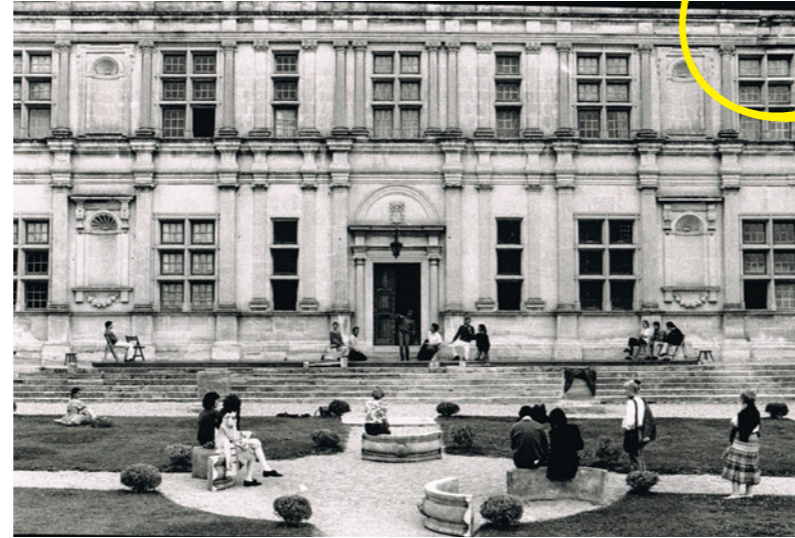
1992 - Le médecin volant / Le sicilien