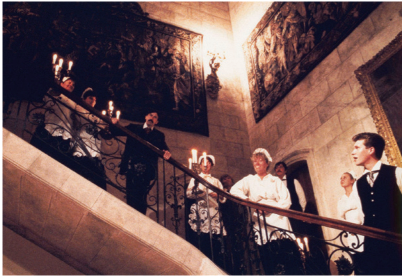
1987 - La Jalousie du barbouillé